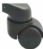
Kolečka pro měkké povrchy (KB)