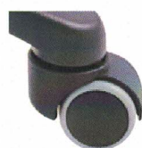
Kolečka pro tvrdé povrchy v (KT)